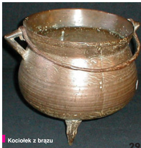
Kociołek z brązu