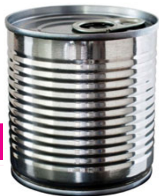
Puszka z cynowanej blachy stalowej

Cyna wykazuje także, bardziej znaną w przypadku niemetali, alotropię. Alotropia to występowanie pierwiastka chemicznego w różnych postaciach charakteryzujących się odmiennymi właściwościami fizycznymi i chemicznymi. W grupie XIV najbardziej znane odmiany alotropowe